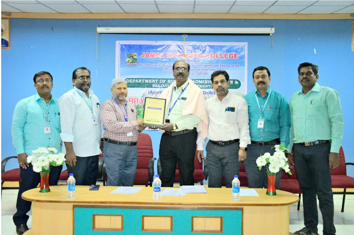
Honoring the Guest