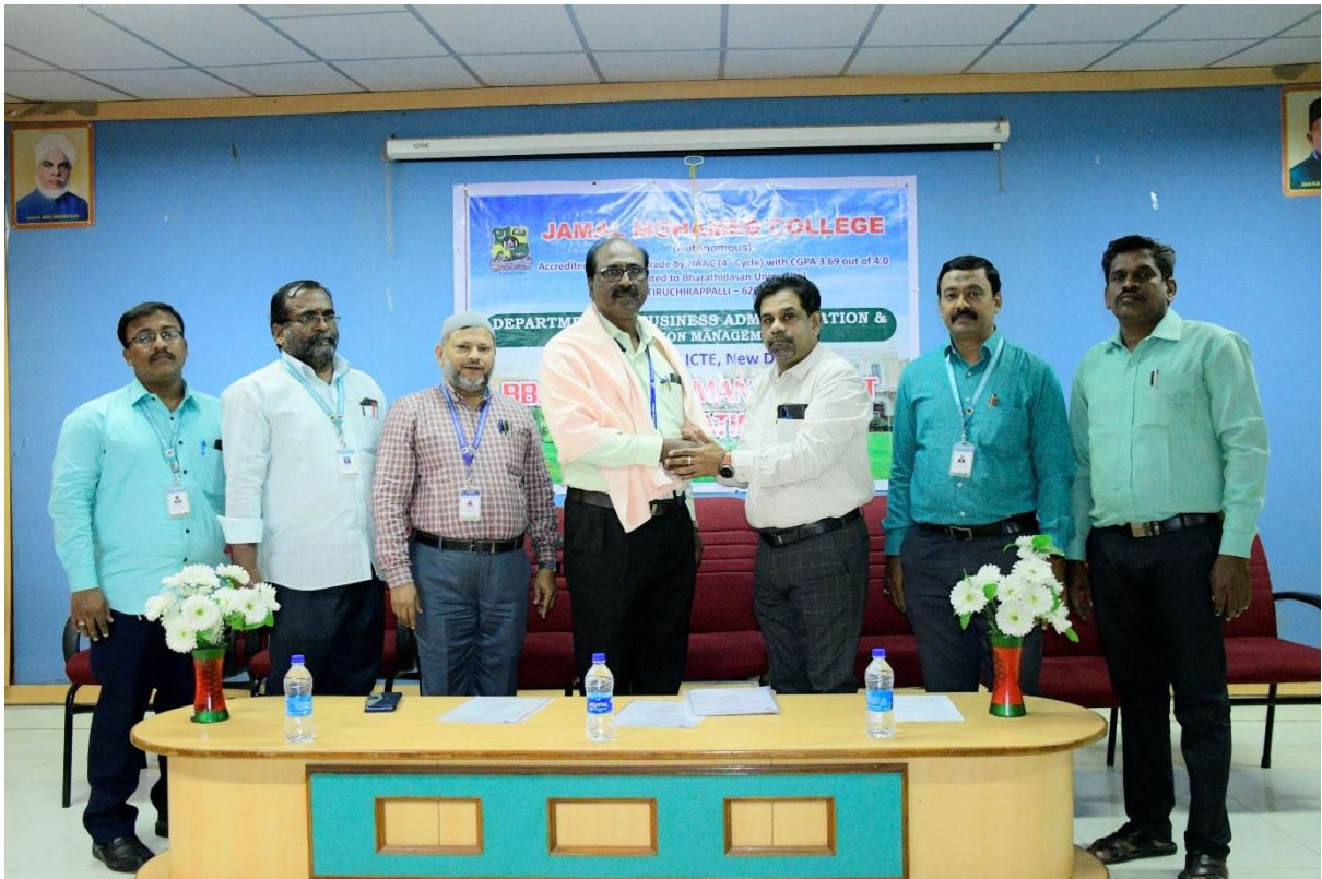
Honoring the Guest