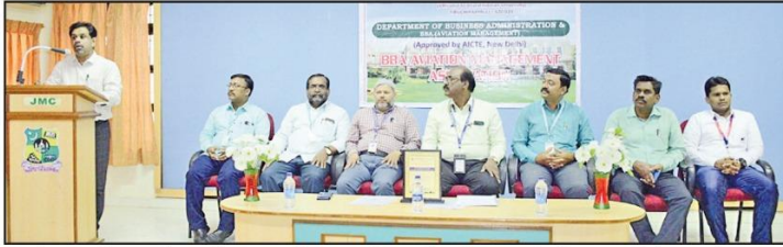
விமான மேலாண்மைத் துறை பேரவை தொடக்கவிழா நடந்தபோது எடுத்த படம்.