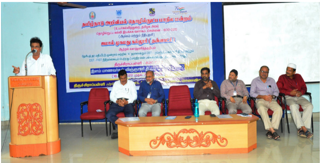
இளம் மாணவர்கள் வீடுதூய் திட்டம் (YSSP) நிறைவுவிழா - 2022