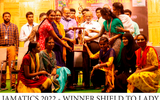
JAMATICS 2022 - WINNER SHIELD TO LADY DOAK COLLEGE, MADURAI TEAM