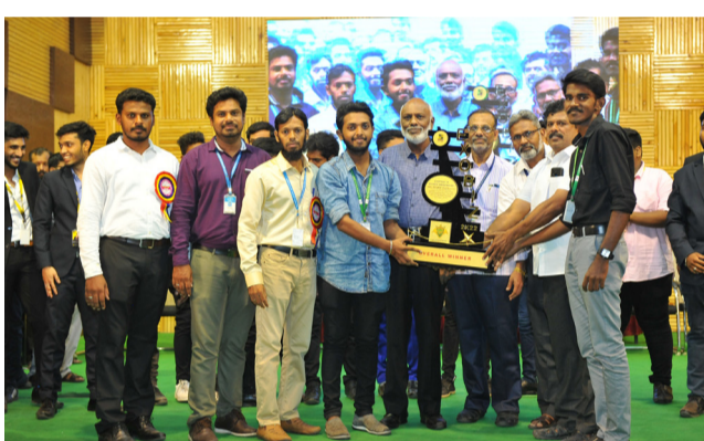
Sastra Deemed University Thanjavur receiving the overall Trophy of EXOBIZ - 2022