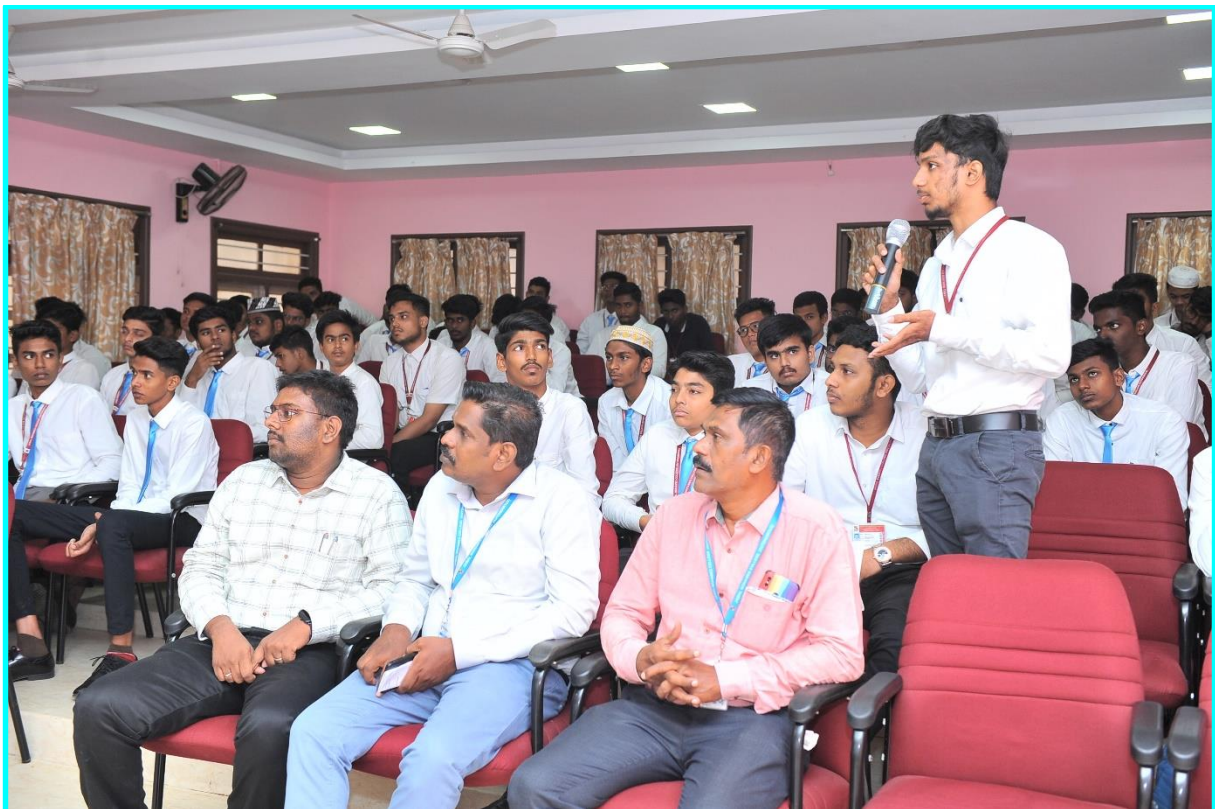
Interaction Session by Students