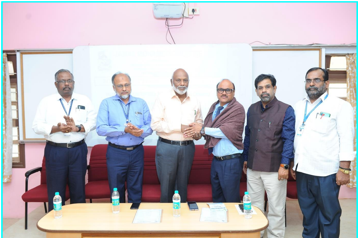
Honoring the Guest