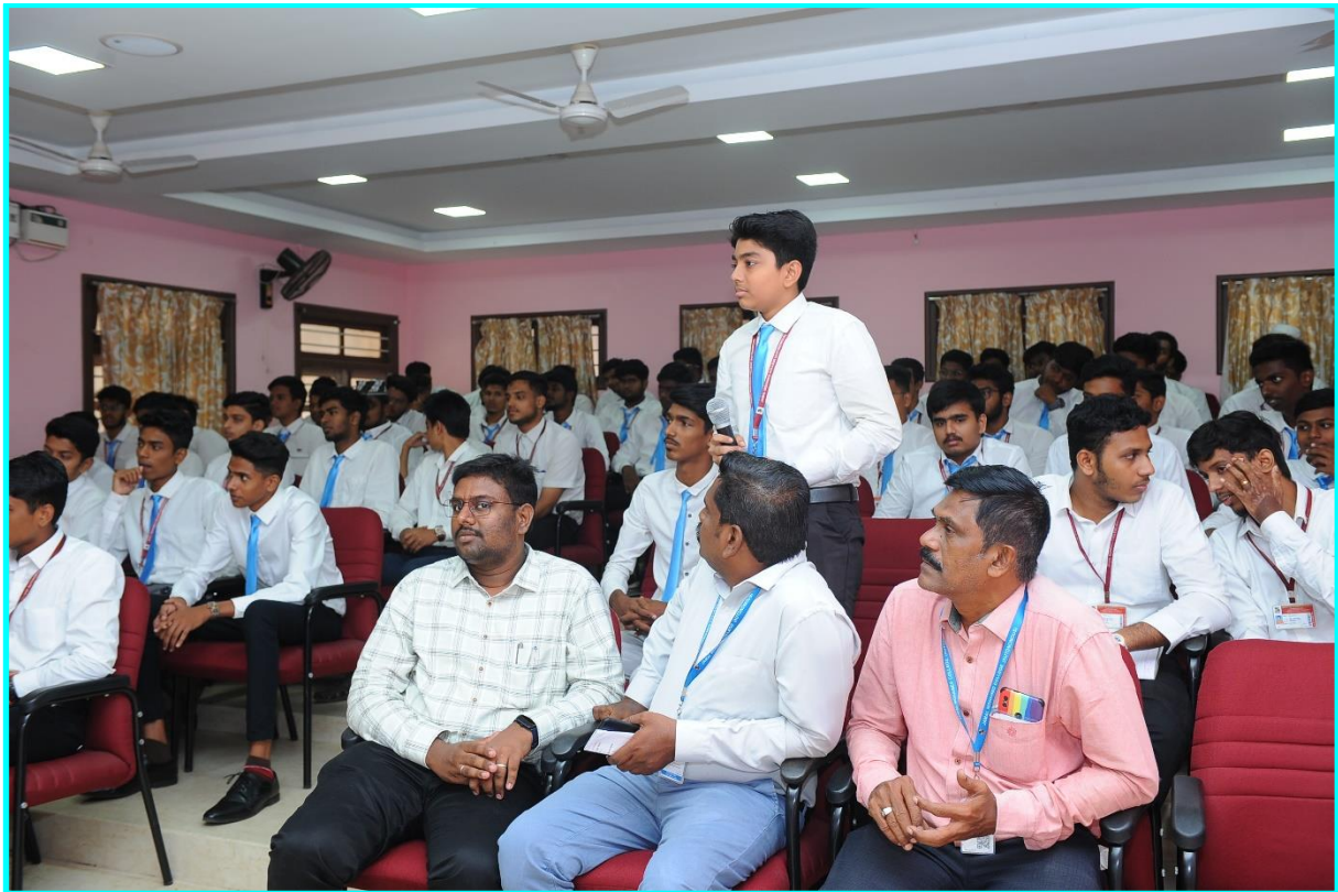
Interaction Session by Students