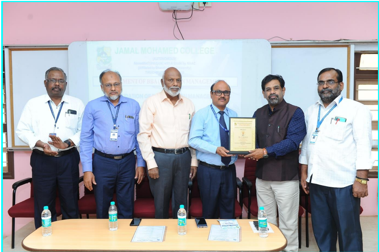
Presenting Memento to the Guest