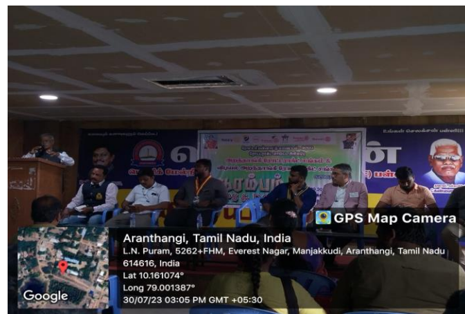
Aranthangi, Tamil Nadu, India L.N. Puram, 5282+FHM, Everest Nagar, Manjakkudi, Aranthangi, Tamil Nadu 614616, India Lat 10.161074° Long 79.001387° 30/07/23 03:05 PM GMT +05:30