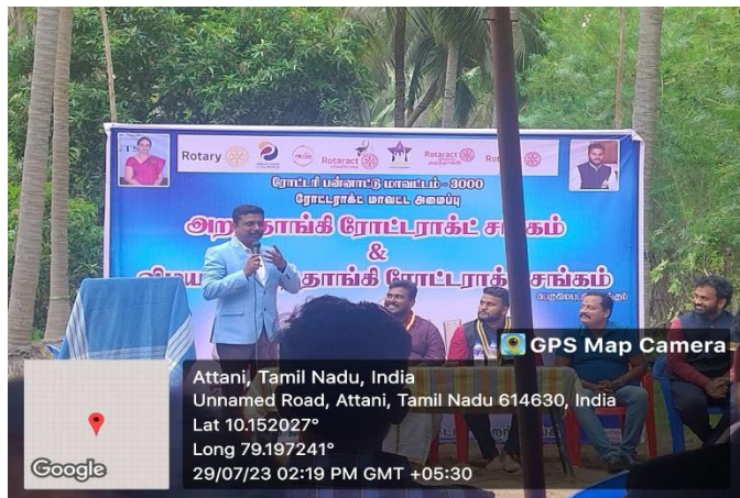
Attani, Tamil Nadu, India Unnamed Road, Attani, Tamil Nadu 614630, India Lat 10.152027° Long 79.197241° 29/07/23 02:19 PM GMT +05:30