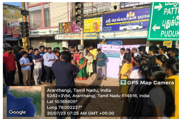
Aranthangi, Tamil Nadu, India 5282+3VM, Aranthangi, Tamil Nadu 614616, India Lat 10.165605° Long 79.002227° 30/07/23 07:25 AM GMT +05:30