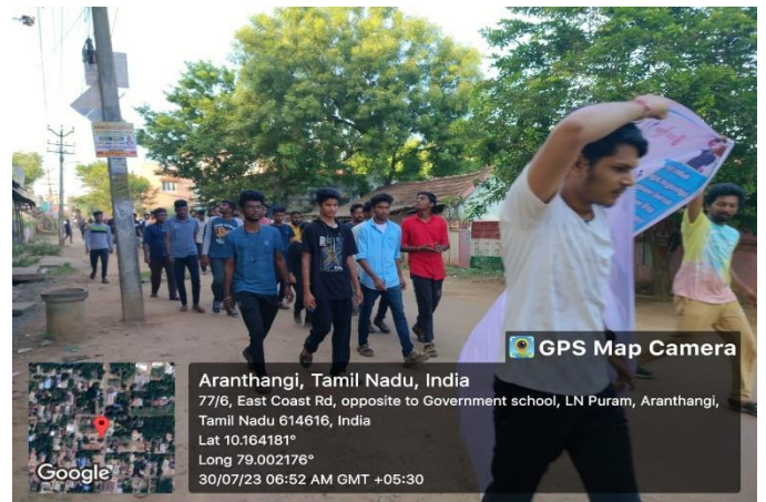
Aranthangi, Tamil Nadu, India 77/6, East Coast Rd, opposite to Government school, LN Puram, Aranthangi, Tamil Nadu 614616, India Lat 10.164181° Long 79.002176° 30/07/23 06:52 AM GMT +05:30