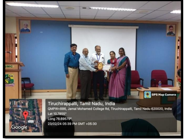
பயிற்சிப் பட்டறையின் ஒருங்கிணைப்பாளருக்குச் சிறப்புச் செய்த போது எடுத்தப் படம்