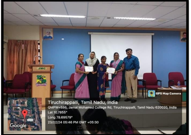
வளநபருக்குச் சிறப்பு செய்த போதும் மாணவிகளுக்கு சான்றிதழ் வழங்கிய போதும் எடுத்தப் படம்