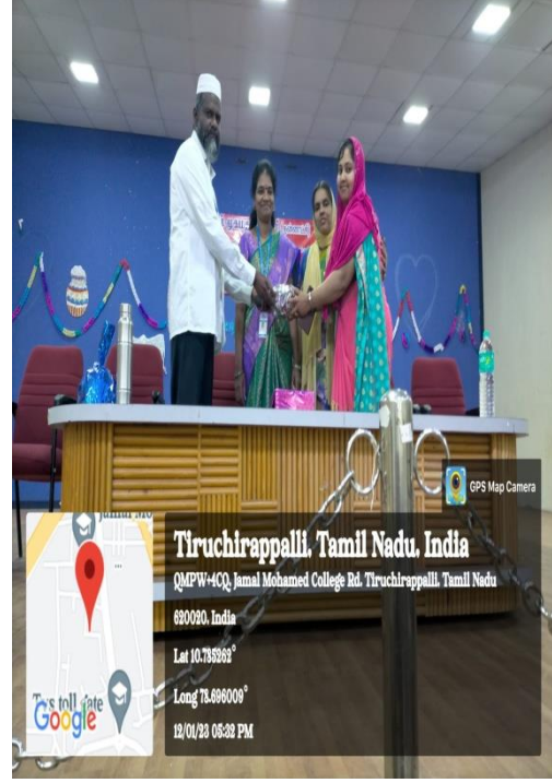
போட்டிகளின் நடுவர்களுக்கு நினைவுப்பரிசு வழங்கியபோது எடுக்கப்பட்ட படம்